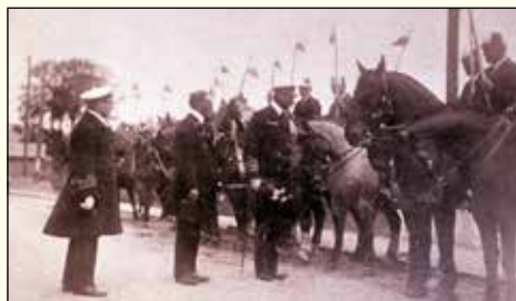
Kongebesøg Chr.X. 1931