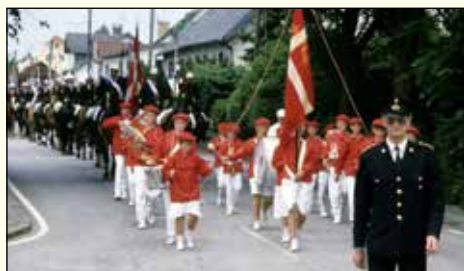
Optog ca. 1990

Som afslutning på denne gode aften sang vi: "Nu er jord og himmel stille!"