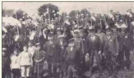
Første ringridning 1904