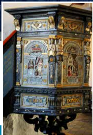
Prædikestol med reliefskåret årstal 1606 og mange fint udskårne detaljer.