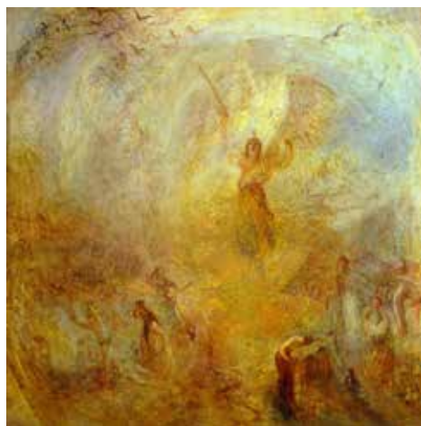
”Englen står i solen” (J.M.W. Turner)