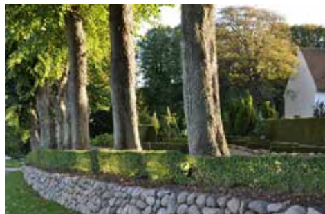
Kirkegården ved Mariekirken i Sønderborg. Udlagt med græs i tidligere gravsteder.