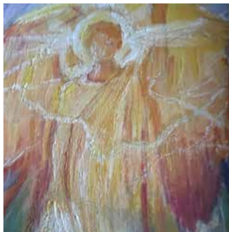
”Ærkeenglen Michael” (2014) Kridt og olie. Birthe Møller