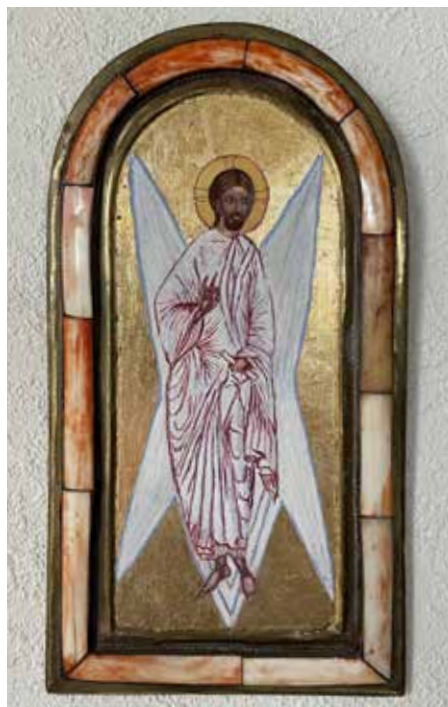
Ikon af Kristus med fire hvide englevinger (2013) Olie og bladguld. Birthe Møller

Birthe tror på, at hvert menneske har en skytsengel, som forsøger at skabe tryghed og godhed omkring os. Englen er med os, helt fra vi bliver født, til vi dør. Hun har selv oplevet at se en skikkelse med ”ravøjne”, som udstrålede et klart lys. Hun opfattede det som en skytsengel, som ville passe på hende. Hun fortæller, at man har