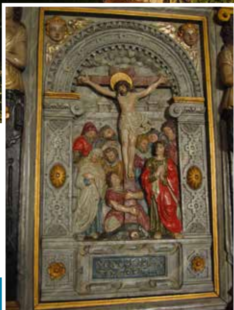
"Kristus på korset". Relief fra prædikestol (1606). "MIN HOPEN TO GODT ALLEIN".