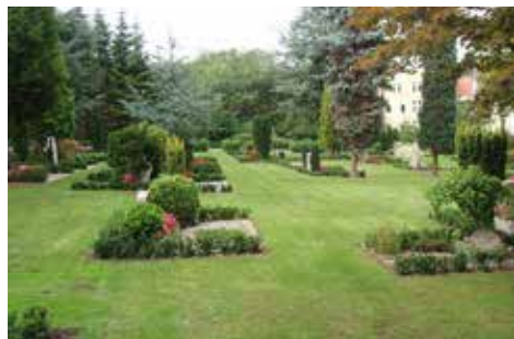
Dige og lindetræer ved Varnæs kirke ca. 2016.

På grund af de mange nedlagte gravsteder og dermed meget forandrede kirkegårde kom i 1987 en lov om registrering af bevaringsværdige gravminder. Den havde fokus på det almindelige, det tidstypiske og det lokalhistoriske og ikke kun på det prangende og storslåede. Det gav problemer i forhold til at nedlægge gravsteder med bevaringsværdige sten, hvor skulle man anbringe disse sten? Mulighederne var enten at frede hele gravstedet, så pasningen, og dermed omkostningen, blev pålagt kirkegården eller/og oprette særlige områder, lapidarer, hvor stenene blev samlet.