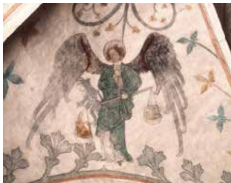
Ærkeenglen Michael. Kalkmaleri fra Højby kirke (Odsherred ca. 1100)

Ezekiels bog som engle med vinger og fire ansigter, og seraferner er seksvingede. Den engel, der bringer budskabet om Johannes Døberens og Jesu fødsel, er ærkeenglen Gabriel. Han optræder også i Daniels bog. Det berettes her, at englen Gabriel står for Guds ansigt og er i Guds tjeneste, og hans ansigt "strålede som lynet" (Daniels bog kap 9,15).