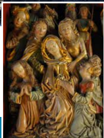
Udsnit fra altertavlen (ca.1490) med Jesu moder, Maria, som er en del af korsfæstelsesscenen på Golgatha.